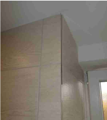
KERAM.OBKŁAD S UKONČUJÍCÍ LIŠTOU